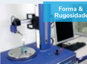
Forma & Rugosidade