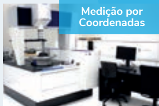
Medição por Coordenadas