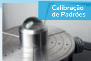
Calibração de Padrões